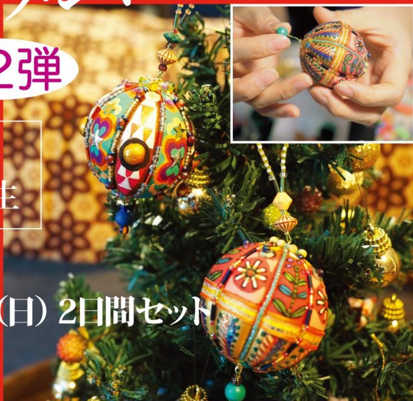
講師参考作品(オーナメント)