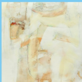
「花露-11」ミクストメディア S8