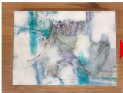
テーマ色を決めて描画