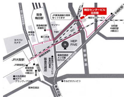
サクラアートサロン大阪（会場地図）