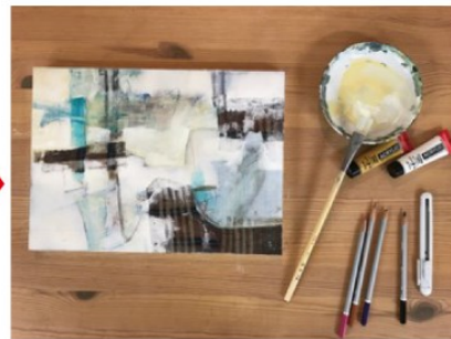
着色・デコラージュ