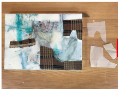
布をボンドで貼る