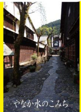
やなか水のこみち