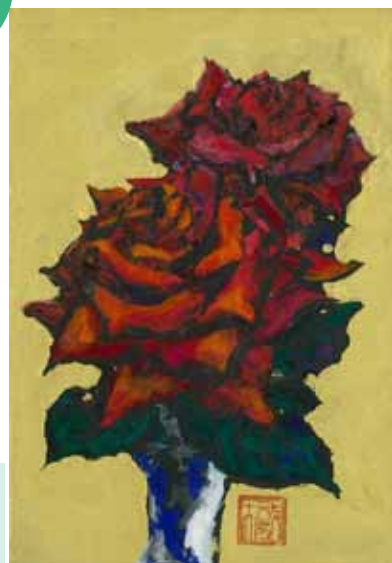
2月コース 指で描く「ばら」 講師参考作品