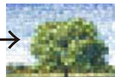
加工画像を元に制作