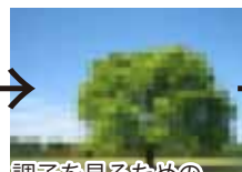
調子を見るための モザイク加工