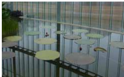
2月22日(日) 新宿御苑 大温室 新宿御苑 新宿門前 集合