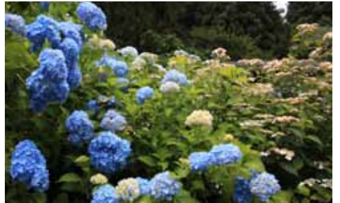
6月28日(日) 駒込 白山神社のあじさい 都営三田線 白山駅 A3 出口 集合