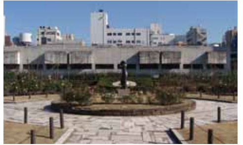
5月24日(日) 本郷給水所公苑 東京都水道歴史館入口前 集合