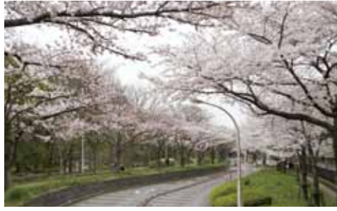
4月12日(日) 水元公園 水元公園サービスセンター前 集合