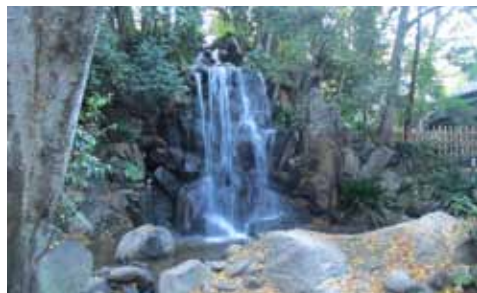
3月8日(日) 王子 名主の滝公園 東京メトロ王子駅 5番出口 集合