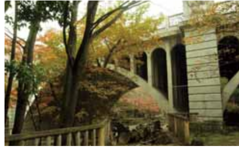
5月10日(日) 音無親水公園 東京メトロ南北線王子駅 3番出口集合