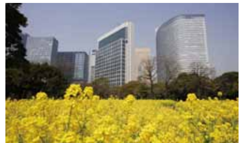
3月22日(日) 浜離宮恩賜公園 浜離宮恩賜公園 大手門橋入口 集合

集合時刻は 13:00 です。遅れる場合は 03(3351)2321 までお電話ください。