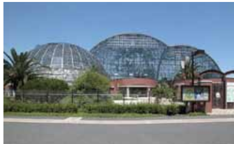
1月25日(日) 新木場夢の島熱帯植物園 新木場駅 出入口1 集合