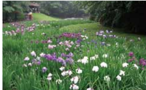
6月14日(日) 小石川後樂園 菖蒲田 小石川後樂園入り口 集合