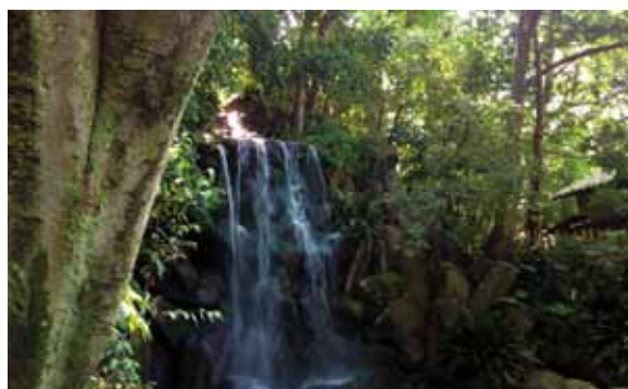
9月13日(日) 王子 名主の滝公園 東京メトロ王子駅3番出口 集合