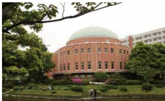
10月11日(日) 旧安田庭園 旧安田庭園南側入口前 集合