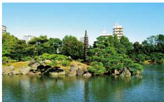
9月27日(日) 清澄庭園 都営大江戸線・東京メトロ清澄白河駅 A3 番出口 集合