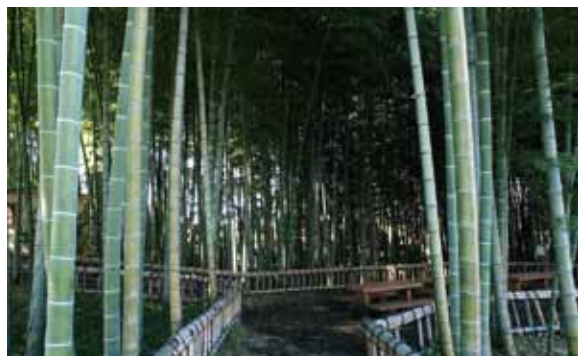
7月12日(日) 東久留米 竹林公園 西武池袋線東久留米駅西口 集合