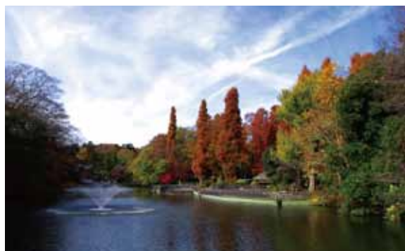
10月25日(日) 井の頭恩賜公園 井の頭恩賜公園内ボート場前 集合