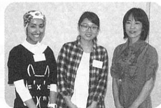
留学生とおやの会里親子対面の会