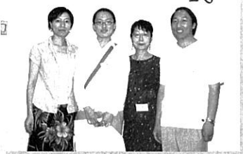
留学生とおやの会 里親 対面の