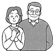
留学生とおやの会 里親 対面の