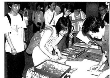
留学生とおやの会 里親 対面の