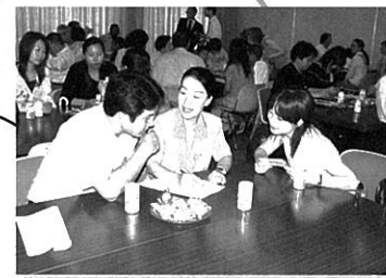
留学生とおやの会 里親 対面の