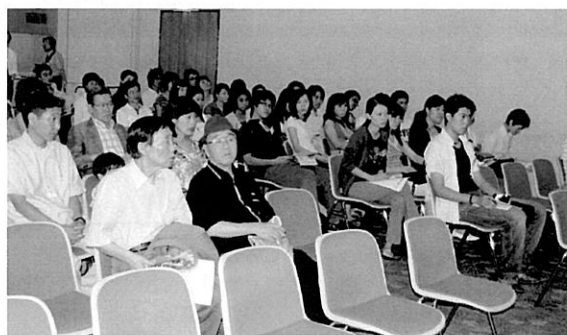
すこし緊張気味でお話を聞きます