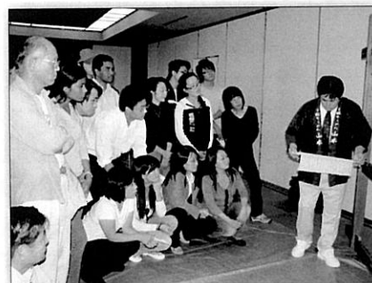
みなさん真剣なまなざし