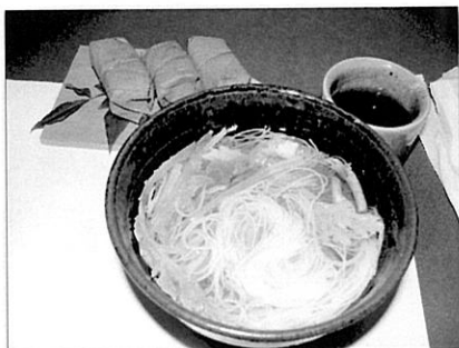
おいしくいただきました！