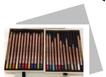
デザインパステル鉛筆