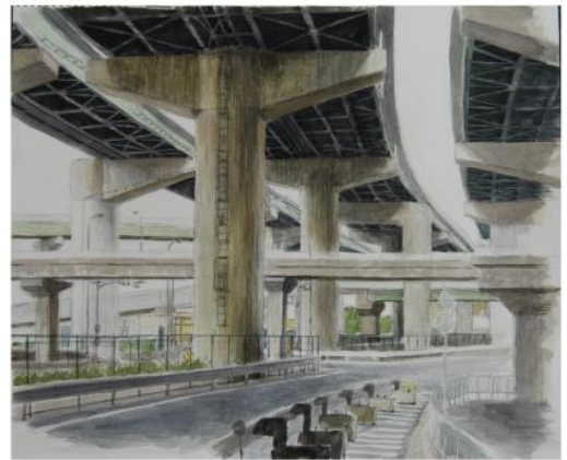
講師参考水彩スケッチ