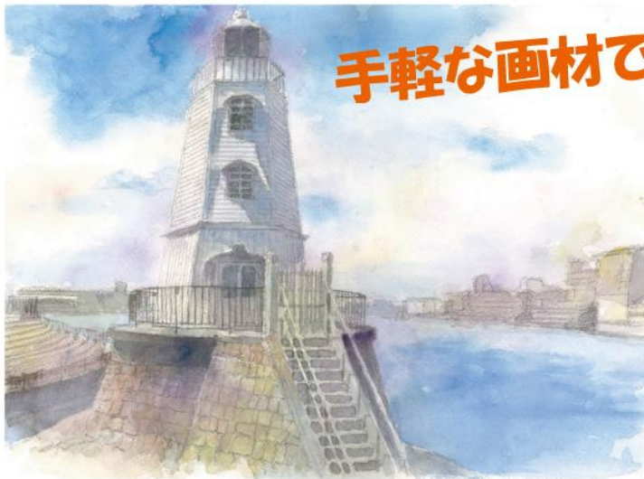
講師参考水彩スケッチ