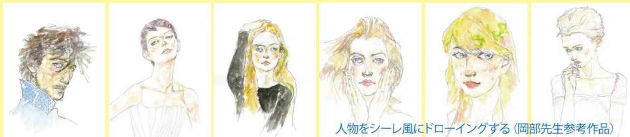
人物をシーレ風にドローイングする(岡部先生参考作品)

STEP② F6号パネルに本制作。アクリル着彩と箔焼き技法。岩絵の具で仕上げます。