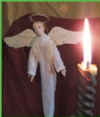
今回のモチーフ資料