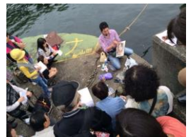
スケッチ前に毎回行われる 推奨画材を使った現場レクチャー