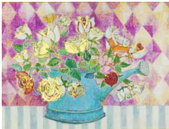
講師参考作品（油彩、石膏、金箔）