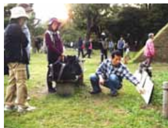
毎回講座の終わりに行われる全体講評会は自分の作品を客観的に見ることができます。