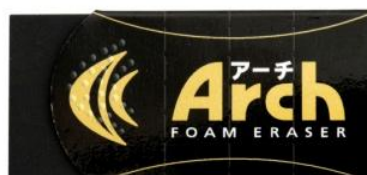
アーチ消しゴムブラック60