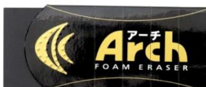
アーチ消しゴムブラック100