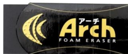
アーチ消しゴムブラック100