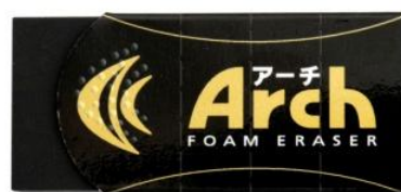
アーチ消しゴムブラック60